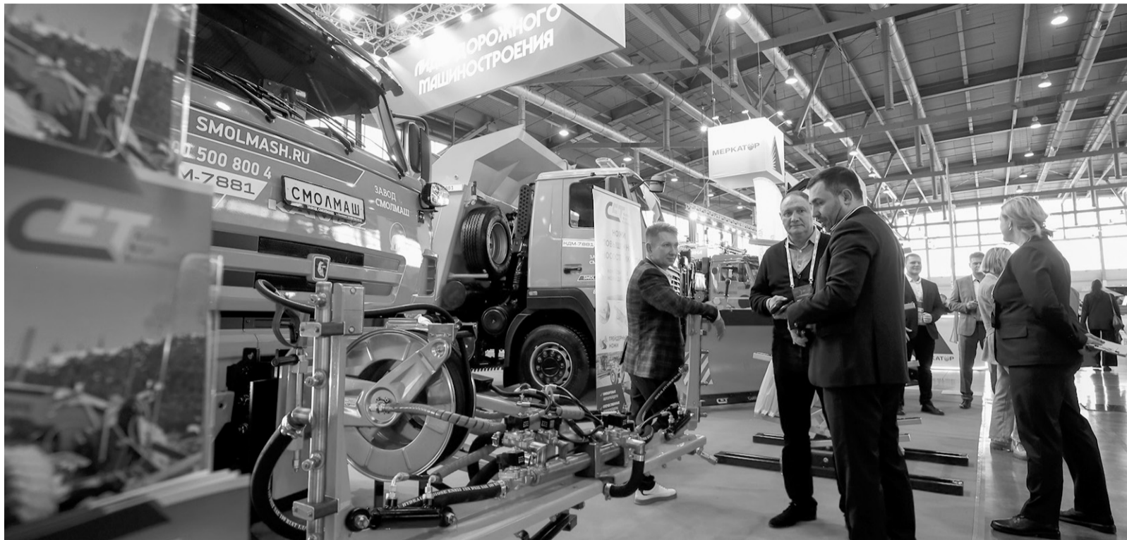
На выставке были представлены инновационные разработки преимущественно отечественного производства

выставка «Дорога 2024» — крупнейшая в нашей стране отраслевая дискуссионная площадка, которая объединяет авторитетных экспертов и ключевых представителей дорожно-транспортного комплекса России. Проходит она ежегодно в самом крупном выставочном центре Урала МВЦ «Екатеринбург-Экспо».