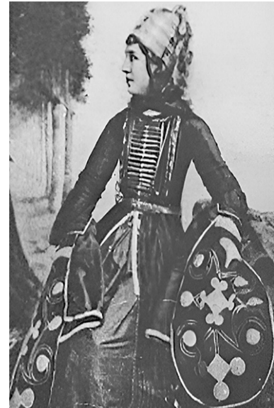
Нарукавные подвески охраняли руки девушки от нежелательных контактов